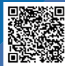
〈感染防止対策取組書QRコード〉

神奈川県では、お店や施設が行っている「 感染防止対策 」を 見える化 するシステムを導入しています。