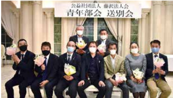
青年部会では湘南クリスタルホテルにて、令和元年度と令和2年度を以って青年部会を規定により卒業される部会員の方々の送別会を開催しました。