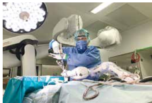
ARTIS phenoを中心とするハイブリッド手術シ ステムに、Cirqロボットアームシステムを連動