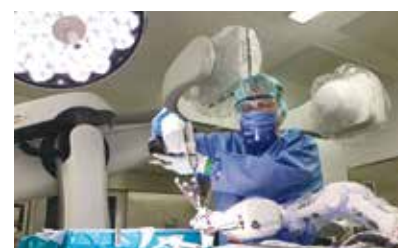
ARTIS phenoとCirq ロボットアームシステム

2022年4月末時点で脊椎手術の総件数5016件。脊柱側彎症が1239件、腰椎2716件、頸椎798件、胸椎134件、その他129件です。スクリューの挿入総本数は約3万本。うち5月に実施した手術でロボットを用いたスクリューの挿入本数は1800本となり世界最多です。