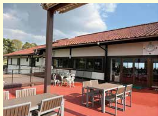
富士山の絶景、四季折々の自然が楽しめる60年の歴史を誇るコース。