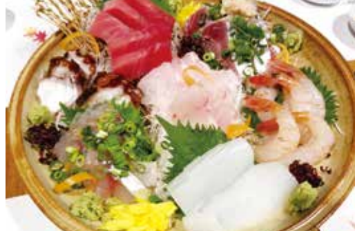
▲豊洲市場や産地直送の旬食材を中心に 仕入れています。