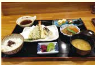
▶季節の料理いろいろ。お酒を飲まない方のための「定食」も好評。