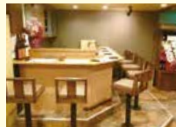
▲テーブル席のほかカウンター席も。14名様からの貸切にも対応しています。