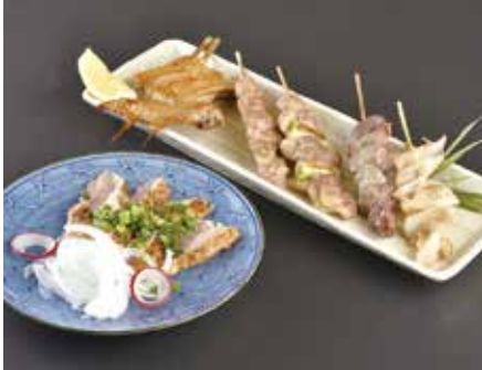
▲「宮崎産鶏のたたき・焼き鳥」。 素材本来の旨味を生かした一品。