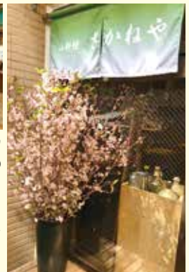
▶緑の看板が目印。外に「喫煙席」も完備。