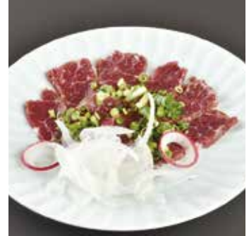
▲馬肉の旨味と甘味を生かした 熊本名物の「馬刺し」を提供。