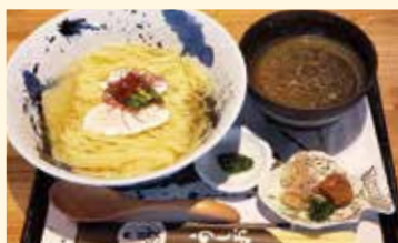
▲鯛出汁の「冷やし昆布水つけ麺」1,300円