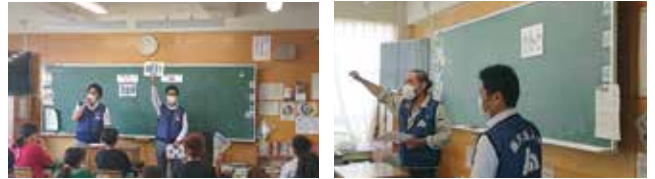
6年生 4クラス 135名