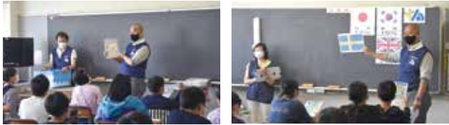
6年生 3クラス 96名