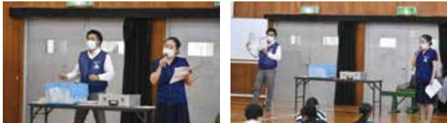
6年生 2クラス 53名