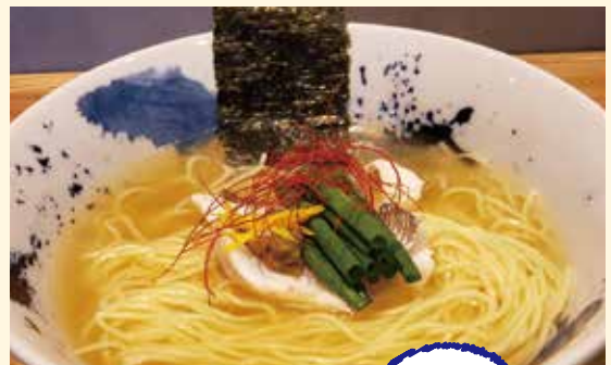
▲「鯛はおめでたい」という意味も込められた「鯛出汁らーめん」1,200円