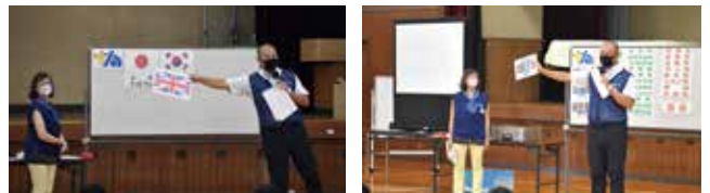
6年生 2クラス 78名