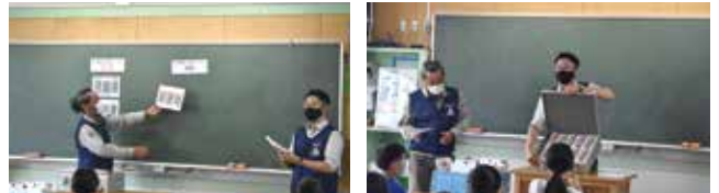
6年生 2クラス 54名

管内の小学校が租税教室を開催する際、講師として青年部会が派遣されていましたが、令和4年度より、女性部会も加わることとなりました。今回は藤沢市内の小学校3校と茅ヶ崎市内の小学校2校で租税教室が開催されました。