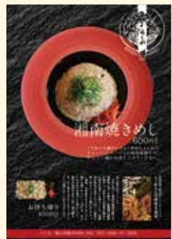
▲鰹節、煮干し、昆布の旨味を抽出した潮ダシで炒めた「湘南焼きめし」600円