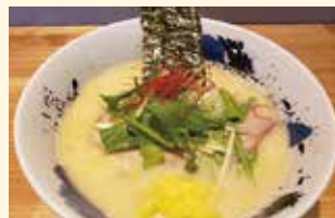
▲胡麻と豆乳を使ったマイルドならーめん「ホワイト」1,100円