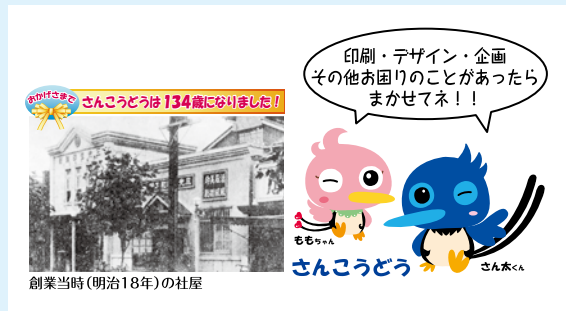
創業当時(明治18年)の社屋