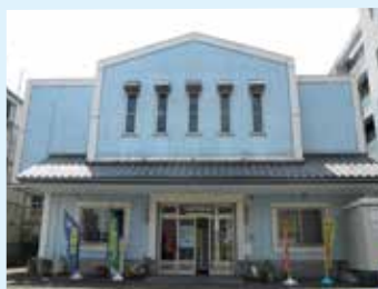
▲明治18年創業。湘南・藤沢で134年の歴史と実績をもつ。