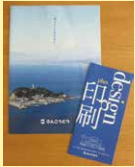
▲投資対効果を考え、提案し企画制作・納品を総合的にお手伝いしています。