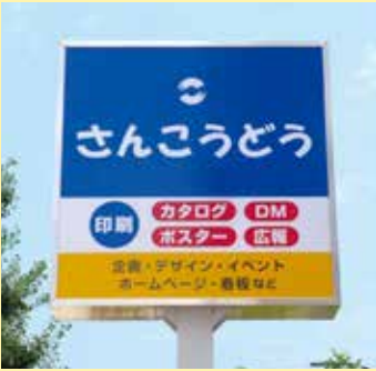
▲旧国道一号線(藤沢宿商店会)。青い看板がひときわ目を引く。