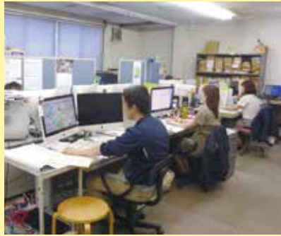
▲藤沢市の行事やイベントほか神社仏閣関係の仕事も請け負う。