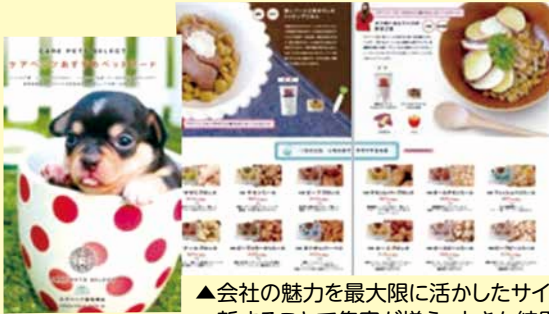
▲会社の魅力を最大限に活かしたサイトを作成。一新することで集客が増え、大きな結果を出しています。