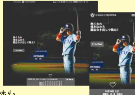
◀「日本体育大学公式野球部のサイト。」