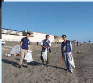
藤沢法人会青年部会のビーチクリーン活動。「藤沢は部会員同士の連携が取れていて、楽しくやりがいがあります」