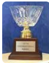
◀青年部・女性部合同での租税教育活動による贈呈。