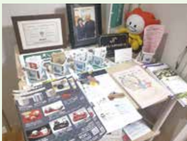
▲関連資料が置かれた入り口。