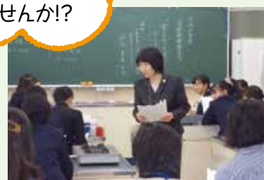
◀学校や役所などで、食育や薬膳に関する講演を行っている。