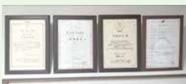
▲壁面に並ぶ食品営業許可証や「全国料理学校協会」「NPO日本食育インストラクター」の認定証。