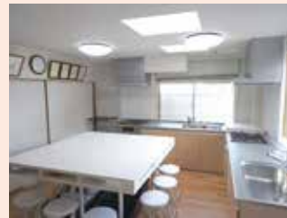
◀システムキッチン2台(シンク・3口ガスコンロ)、キッチン用品一式、備品類を完備。