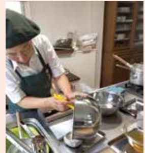
▲自分のカラダの声を聴き、季節の旬の食材を使います。